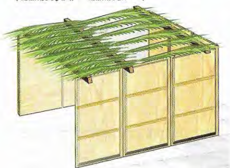
צילתה מרובה חמתה מרובה מחמתה מצילתה במשור רוב שטח הסוכה מיקוט שטח הסוכה

כשרוב שטח הסוכה חמתה מרובה, אך בכללותה צילתה מרובה